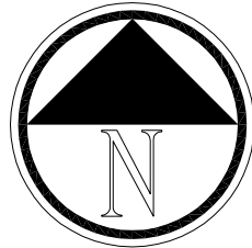
PLANIMETRIA GENERALE Scala 1:1.000